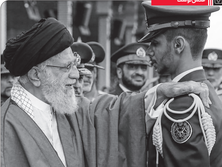
اعطای سردوشی به دانش‌آموختگان دانشگاه افسری ارتش | ۱۳۹۸/۸/۸