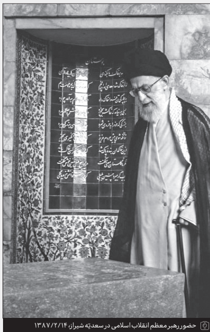
حضور رهبر معظم انقلاب اسلامی در سعدی‌ته شیراز، ۱۳۸۷/۲/۱۴

حضرت آیت‌الله خامنه‌ای، به صورت مکرر و سالهای طولانی است که در بیانات خود ویژگی‌های زبان فارسی را برشمرده و بر ضرورت پاسداشت این زبان فاخر و زیبا، تأکید کرده‌اند. رهبر انقلاب در دیدار شاعران در تاریخ ۱۴۰۳/۱/۶ فرمودند: «به نظر من زبان فارسی کاملاً دارد مظلوم واقع میشود. حال این اواخریک کارهایی دارد میشود، بعضی‌ها در انجمنهایی یک کارهایی دارند انجام میدهند، اما ما بیش از این احتیاج داریم به تقویت زبان فارسی.» نشریه خط حزب‌الله به مناسبت روز اول اردیبهشت ماه، سالروز بزرگداشت سعدی و روز نشر فارسی، برخی توصیه‌های رهبر انقلاب درباره پاسداشت زبان و ادبیات فارسی را مرور کرده است.